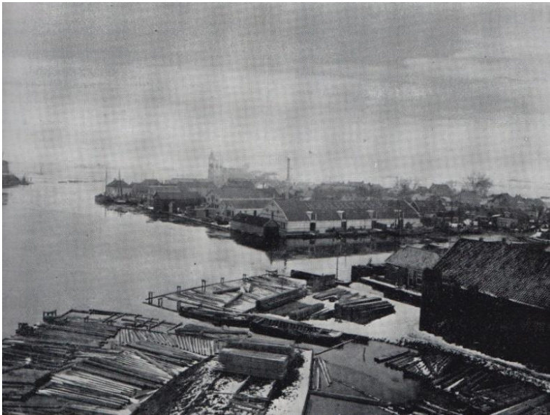
Foto nommen fan de houtmole de Jonge Valk mei gesicht op de Baai. Foaroan sawol stammen foar de mole as foar it fabryk. Rjochts de houtskuorrefan dizze mole dy letter noch jierren troch Halbertsma brûkt is. Lofts de Rjochte Grou mei noch in glimp fan de oaljemoale. (foto om 1910 hinne)

Waard it hout jierrenlang mei in pont oerbrocht, nei 1951 koe dit mei de oanlis fan de brêge yn de J.W. de Visserwei, ek oer de dyk. Nei de grutte brân op 11 juny 1960 ferdwynt ek it jierrenlange oansjen fan de houtskuorren op de oare kant. Ek de behoefte om safolle hout yn opslach wurdt minder en de hiele produksje ferhuzet yn de 70-er en 80-er jierren nei de oare (noard)kant.