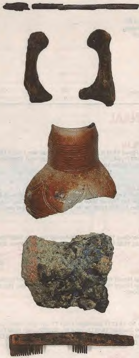
Foto's van boven naar onder: de wandelstok, de duimbotten van de vrouw, restanten van een steengoedkruik, een slak van ijzerproductie en geheel onder de kam uit het graf.

Eind negentiende eeuw veranderde het dorpsplein ingrijpend. De historische Waag en een bijbehorend haventje verdwenen. Ook een armhuis en een molen gingen tegen de vlakte. Er heeft ook een school in deze omgeving gestaan. Van de Waag en molen vonden de archeologen geen spoor, maar wel van de school en de kade van de haven. Die was opgemetseld met gele IJsselsteentjes en de onderzoekers analyseerden verschillende stukken eikenhout, die hier ook deel van uitmaakten.