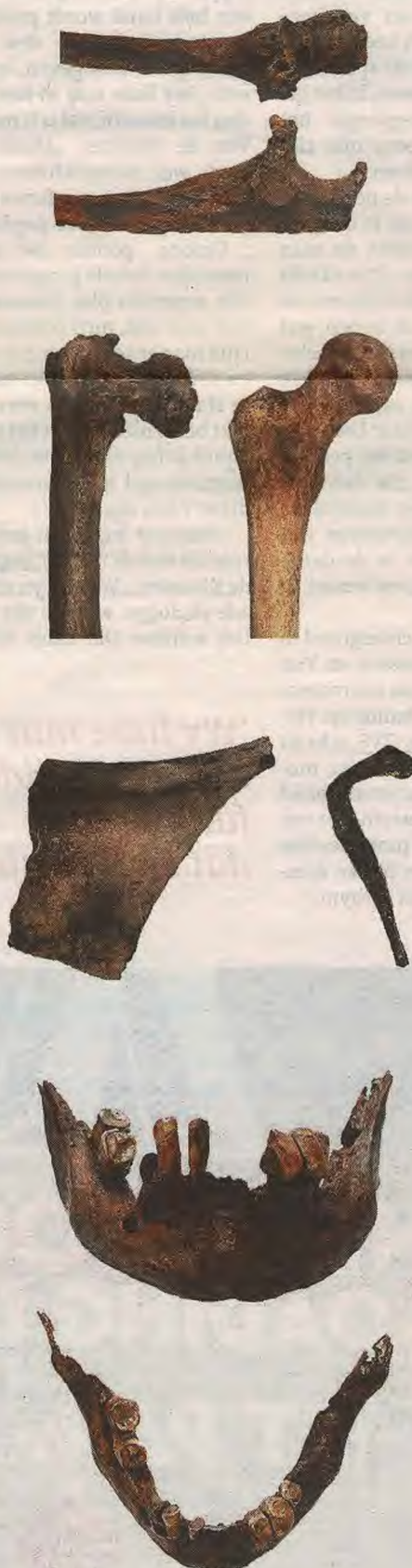
Foto's van boven naar onder: beelden van een aangetaste ellepijp en mismaakte kop van het rechter dijbeen. Vervolgens een brokstuk van een middeleeuwse bolpot. Geheel onder: De zwaar gehavende onderkaak.

Predikers zoals hij werden gesteund door christelijke Frankische vorsten, van wie we Karel de Grote het beste kennen. Hij verbood het heidense gebruik om doden te cremen.