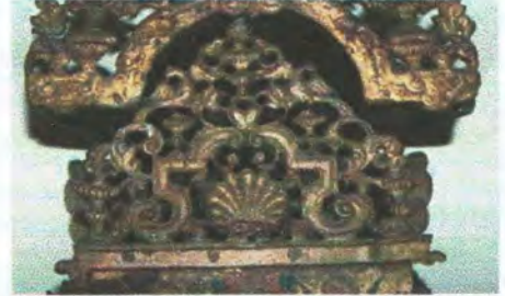
Afb. 4 - De 5, voor de wonden van Christus. De 5 van de vijf Bijbelboeken.

een duif. Duif en ook anker zijn symbo- len van de hoop. In het midden boven zien we een vrouw met kinderen hetgeen liefde betekent. De totale voorstelling is afgeleid van 1 Corinthe 13 vers 13: "Zo blijven dan geloof, hoop en liefde maar de meeste van deze drie is de liefde".