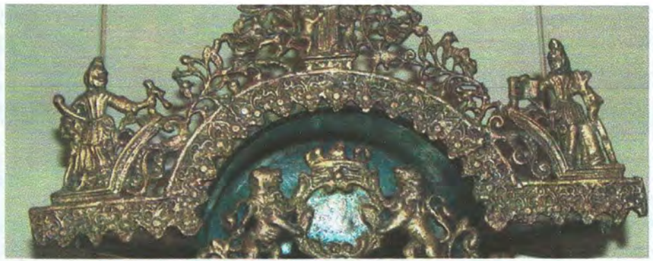
Afb. 2 - Geloof, hoop en liefde.