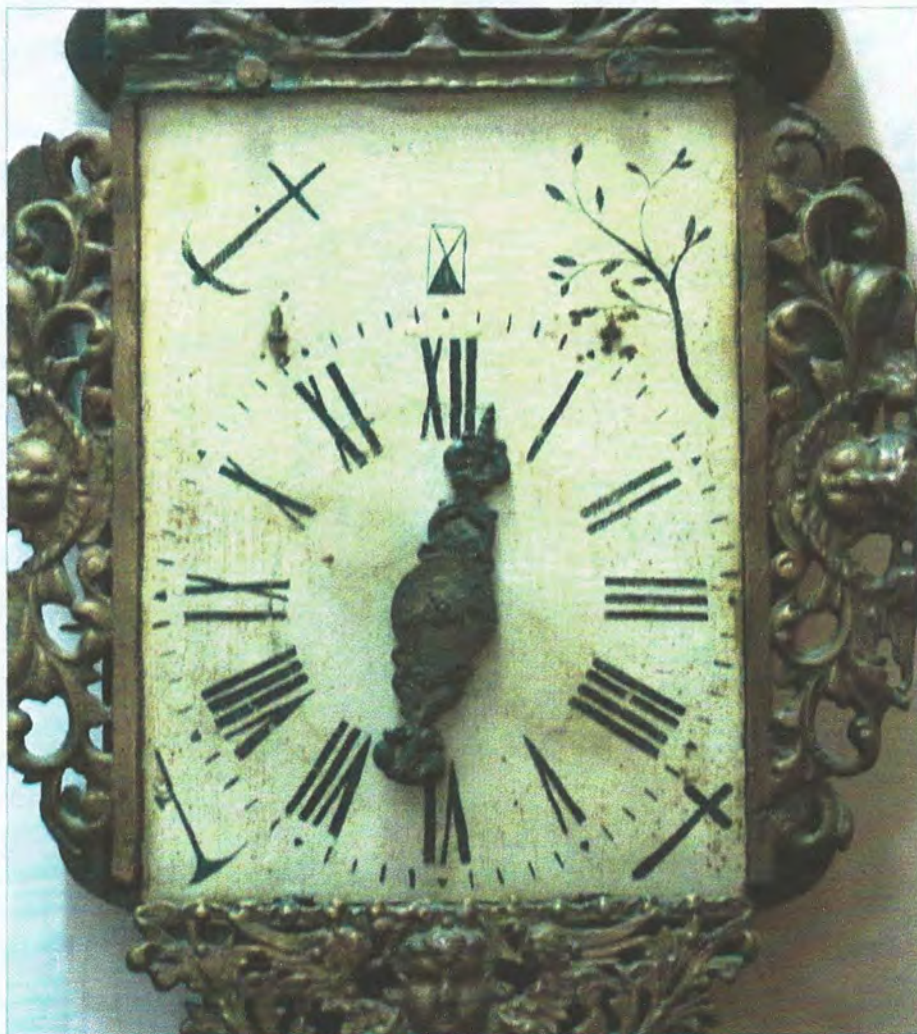
Afb. 7 - Eenvoudige symboliek met o.a. kruisanker en maretak.

onder de houweel als teken van kracht, maar ook dood en sterfelijkheid. Rechts- onder het kruis als symbool van de hoop. Rechtsboven de maretak (mistletoe) als bescherming tegen boze geesten, maar deze kan ook inhouden een vredesboodschap, liefde, geluk en vruchtbaarheid.