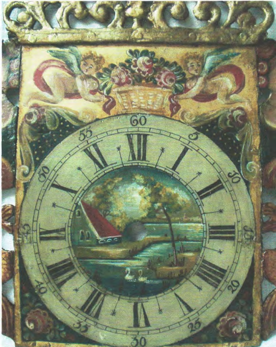
Afb. 1 - Zwanen in eigen water. Bloemenmand met rozen

De meest belangrijke hiervan zijn wel de liefde, trouw, geluk, onschuld en het lijden van Christus. Er is ook een asso-