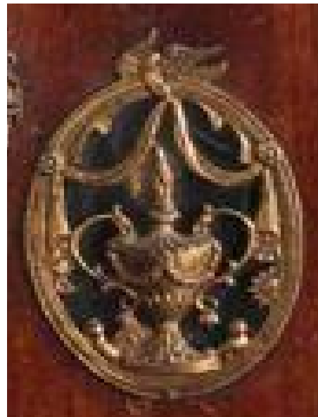
Fries Museum, Leeuwarden Collectie Koninklijk Fries Genootschap