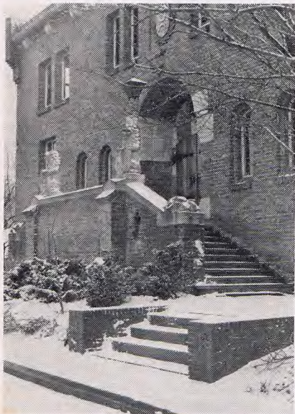
Het karakteristieke raadhuys van Grouw herbergt een oudheidkamer in de kelders.

Het is niet de hoeveelheid water en de hoeveelheid landelijke ruimte, waardoor Grouw, bijna 4000 zielen tellend hoofddorp van de gemeente Idaarderaardeel, bij zovelen het verlangen oproept er te wonen of er zijn vakantie door te