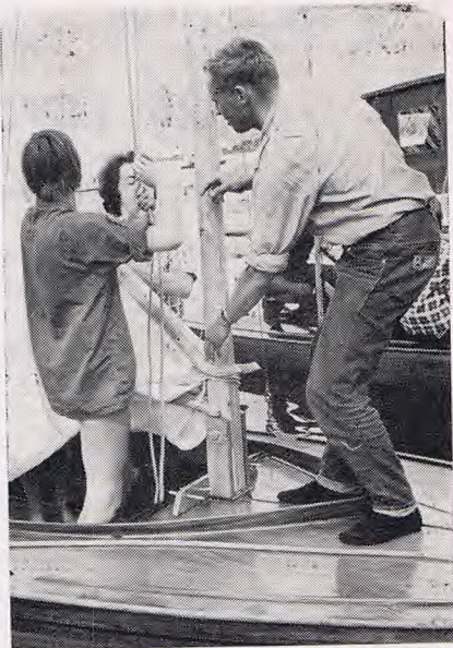
In Grouw hijsen 1000-den de zeilen en wie het niet kan, wordt het op de zeilscholen desgewenst snel geleerd.

Zo is ook bij gemeenschappelijk initiatief van de drie gemeenten, gelegen in het mooiste watersportgebied van West-Europa, de waakzame hand uitgestrekt over zowel de conservering van dit kostbare bezit, als de behoedzame en gecoördineerde ontwikkeling en verrijking ervan en de hygiëne.