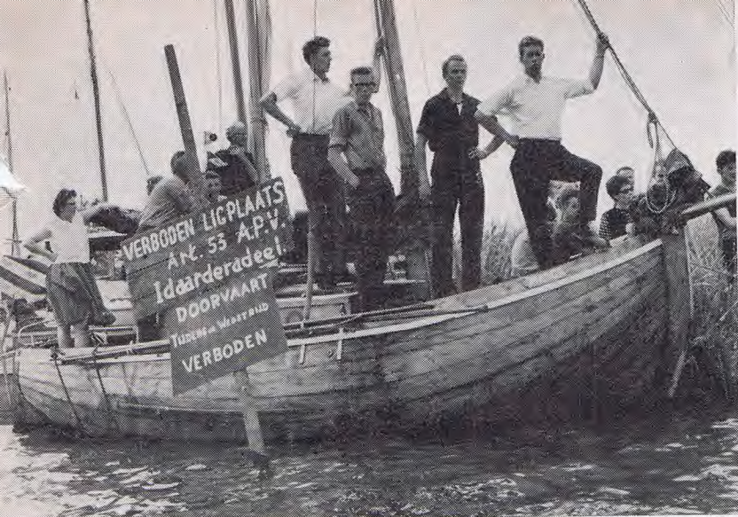
In Grouw heeft iedereen altijd gelijk wanneer hij doet wat hij het liefste doen wil, nou ja, bijna altijd.

brengen. Het is ook niet het levendige karakter van Grouw, enerzijds gevormd door zijn verscheidenheid aan inkomstenbronnen (industrie en recreatie, middenstand en landbouw, botenbouwers en zeilmakers, hotels en restaurants, botenverhuurders en motorenherstellers, aannemers, rondvaartbedrijf en watertaxi), anderzijds gevormd door zijn verrassende structuur als woonoord (smalle steegjes, verrassende doorbraken, een sfeervolle dorpskom, een aantrekkelijk uitbreidingsplan). Het is noch het niveau van zijn cultureel verenigingsleven; welk dorp van deze omvang presteert het om ieder jaar uit eigen kracht (schrijven, componeren, regiseren en spelen) een origineel St. Pietersprookje ten tonele te voeren, dat berstens volle zalen trekt! Het is evenmin zijn intense belangstelling voor de vogelbescherming, noch zijn drang naar de wedstrijdsport.