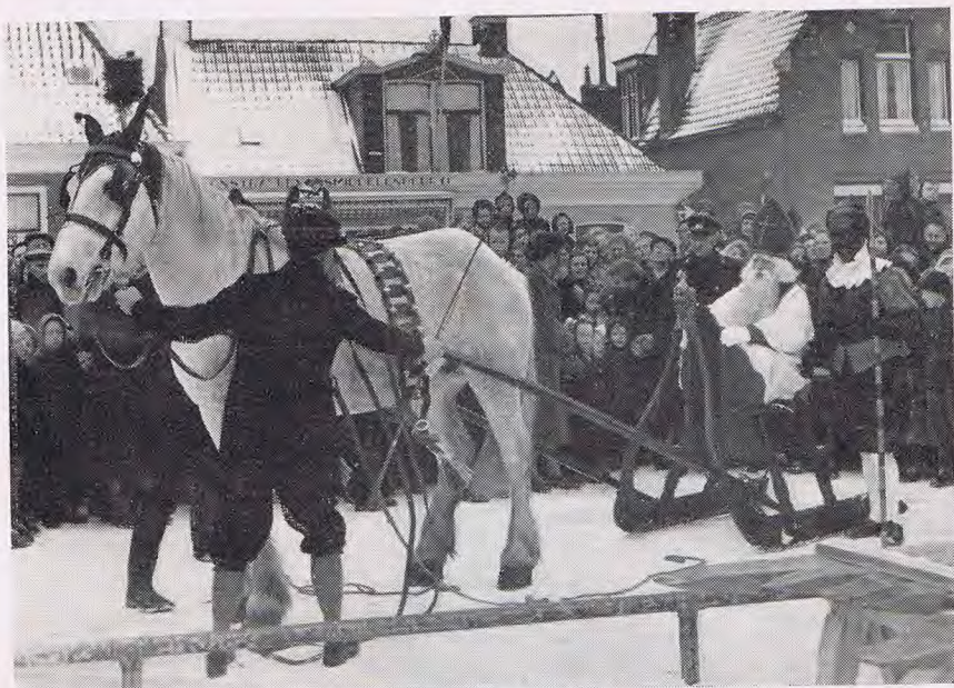
. . . en wanneer er sneeuw ligt komt „kerkvoogd Sint Pieter“ per arreslee . . .

hoog, dat daar op die driesprong een eind kwam aan de charitatieve gemeenschap. Sint Nicolaas nam alle pakjes mee en ging door naar de Friese hoofdstad, Sint Pieter reisde terug naar Spanje, keerde terug met andere geschenken en begon op die manier een eenmanszaakje in Grouw, dat natuurlijk door Sint Nicolaas was overgeslagen. Door al dat gereis kwam Sint Pieter pas op 21 februari in Grouw terug en zodoende . . .