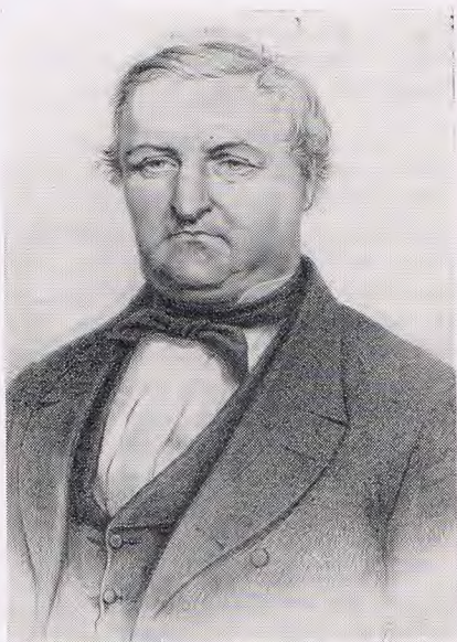
dr Eeltsje Halbertsma befaamd medicus en Fries dichter.

innering aan de schrijvers zijn er in het huidige postkantoor dat hun geboortehuis is enkele gedenksteden en Grouw heeft niet voor niets dokter Eeltsje een