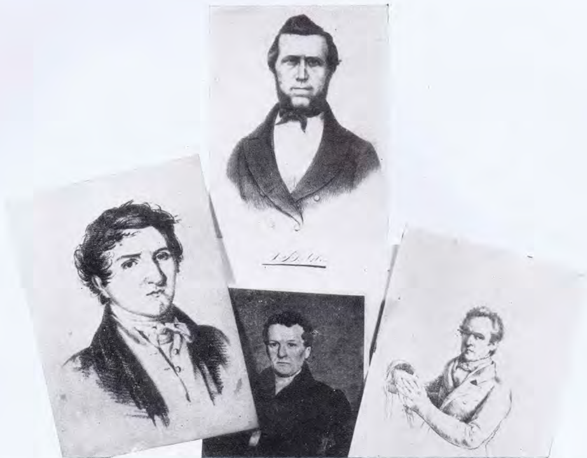
Boven: Harmen Sytstra (1817-1862), grondlegger der Friesche beweging. — Beneden van links naar rechts: Eeltsje Halbertsma (1797-1858), Tsjalling Halbertsma (1792-1852), Joost Halbertsma (1789-1869), schrijvers der „Rimen en Teltsjes.”

de aan poëzie vaak zoo rijke oud-Friesche wetten is het de aarde, de hoeve, het recht, de vrijheid die de aandacht opeischen. Nu komt de Friesche boer op den voorgrond; maar het is alsof de vrijheidsliefde van den Frieschen zeeman voor eeuwig in zijn bloed zal blijven.