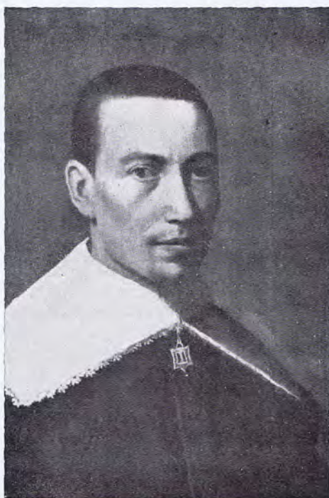
GIJSBERT JAPIKS (1602-1666) (Naar een schilderij in het Fr. Museum).

Er is slechts één weg die tot het zieleven van het Friesche volk voert: de weg der Friesche taal. Gemakkelijk te vinden is die weg niet, en de vreemdeling die zooveel Nederlandsch in Friesland ziet en hoort, kan zich zelfs gaan afvragen of hij wel volstrekt noodig is. Maar hij vergist zich als hij in het Nederlandsch spreken van zoovele Friezen, waarmee hij in aanraking komt, alleen een bewijs van hoffelijkheid of zelfs van meegaandheid meent te zien. Het gebruik van Nederlandsch in Friesland is geen factor die mensch aan mensch verbindt; het scheidt eerder afstand. Een Fries zal tegenover iemand die hij niet als „ien fen ús” beschouwt, zelfs op verzoek niet graag en vlot Friesch spreken; hij deelt er al te veel van zichzelf in mee, geeft zich meer bloot dan tegenover den vreemdeling voegzaam is.